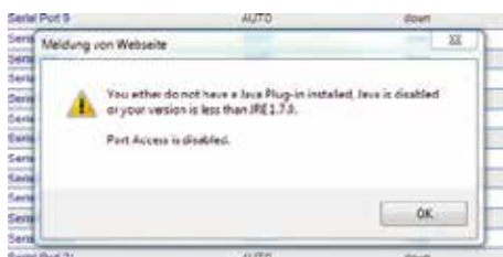
Java ist für die Nutzung des Dominion SX2 zwingend erforderlich.

Router, Server, Security Appliances, Rack-PDUs, virtuelle Hosts sowie Wireless- und Telekommunikationssysteme, bietet sich für einen Anschluss an. Der SX II unterstützt eine große Anzahl von Serial-over-IP-Verbindungen über SSH/Telnet Client, Web-Browser, Command Center, Telefonmodem, Mobilfunkmodem und den di-