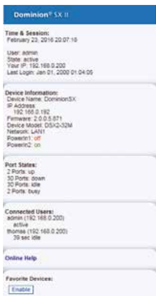
Alle wichtigen Infos auf einen Blick: Wer greift gerade von wo aus zu?

Schlussendlich hat der Administrator über den Dominion Zugriff auf die lokalen Konsolenzugänge der angeschlossenen Geräte. Durch einen Klick auf „Serial Port x“ erweitert sich ein Kontextmenü und der Administrator greift über ein Konsolenfenster auf das Gerät zu, als wäre das Kabel direkt in den seriellen Port eingesteckt. Die „Serial Console“ von Raritan beschränkt sich auf die notwendigen Funktionen. Bei